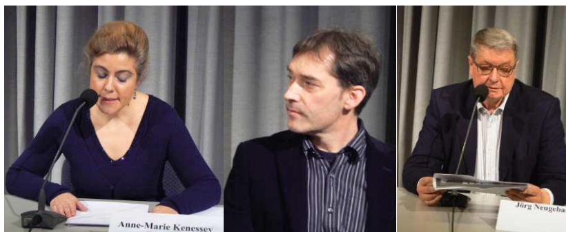
Die drei Gewinner des Lyrikpreis München.